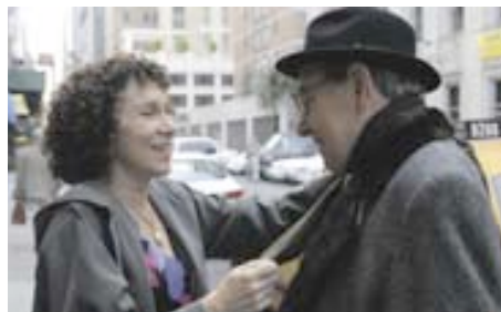
Love Comes Lately – Für die Liebe ist nie zu früh

animierten Gäste erinnern also nicht grundlos an den expressionistischen Film und Cartoons der Zwanziger. Eine schräge kleine Komödie mit viel Charme. UCI Annenhof 7, 19.3., 14:00 KIZ, 21.3., 21:00