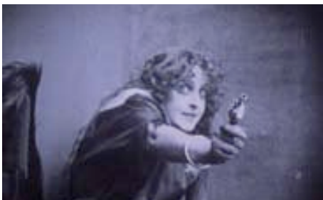
FILM IST. a girl &amp; a gun